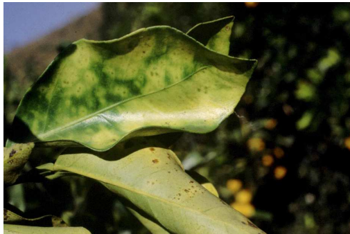
Clorosis internervial y moteado en hojas de naranjo

X. fastidiosa invade el xilema de la planta hospedadora. Su multiplicación en el interior de los vasos puede llevar a la obstrucción del flujo de savia bruta, principalmente agua y sales minerales. Los síntomas varían de unos hospedadores a otros. En algunos se corresponden con los síntomas típicos de estrés hídrico: marchitez o decaimiento generalizado y, en casos más agudos, la seca de hojas y ramas, y finalmente la muerte de toda la planta. En otros casos los síntomas se corresponden más a los provocados por ciertas deficiencias de minerales, como clorosis internervial o moteado en hojas.