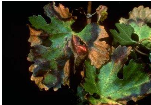
Necrosis marginal en hojas de vid