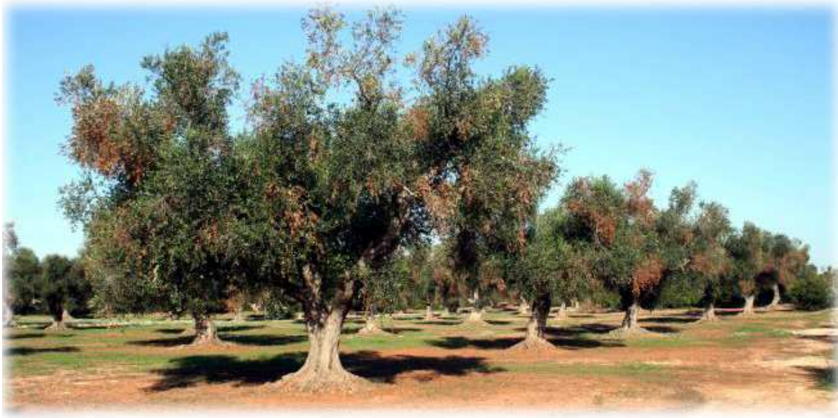
Ramas secas en olivos

En el foco detectado en Italia los olivos mostraban seca de hojas, de ramas e incluso de árboles enteros. Sin embargo, se sabe muy poco de la patogenia de X. fastidiosa en olivos y no está claro si estos daños son atribuibles a esta bacteria en exclusiva, ya que en la mayoría de los árboles la bacteria aparecía junto a diversos hongos patógenos, principalmente de los géneros Phaeoacremonium y Phaeomoniella .