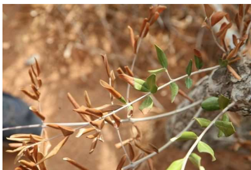
Hojas secas en olivo