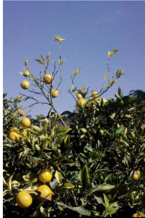
Clorosis y defoliación en naranjo